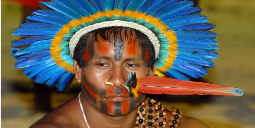
Een lid van de Braziliaanse inheemse bevolking in traditionele uitrusting.

aarde. Toen hij klaar was met Brazilië vroeg een engel: Heer, dit is een van de mooiste regio's op aarde geworden, een meesterwerk. Is dit het aards paradijs? God antwoordde: neen, wacht maar af tot je ziet welk volk ik er ga plaatsen“. Zelfs Brazilianen kunnen ermee lachen, maar het blijft altijd een beetje 'lachen als een boer met kiespijn'.