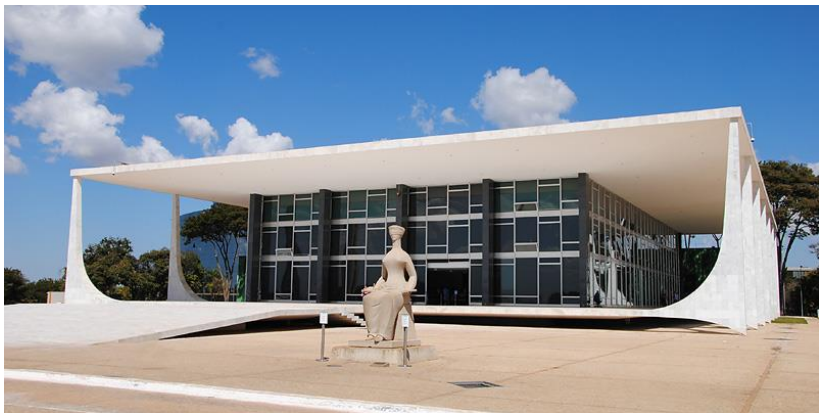
Het gebouw van het 'Supremo Tribunal Federal' in de hoofdstad Brasília, Distrito Federal.

De 26 + 1 deelstaten worden geleid door een gouverneur die verkozen wordt voor 4 jaar, mogelijk te verlengen met dezelfde periode. Dit geldt ook voor de burgemeesters van de gemeentes. Zowel op het niveau van staat als gemeente is er slechts 1 kamer van ‘deputados estaduais’ (staat) of ‘vereadores’ (op gemeentelijk niveau). De juridische macht is in handen van 11 ministers die aangeduid worden door de president, op advies van de senaat. De ministers van het Supremo Tribunal Federal worden niet automatisch vernieuwd bij elk presidentieel mandaat, dit gebeurt enkel als een van hen op pensioen gaat, of na een overlijden.