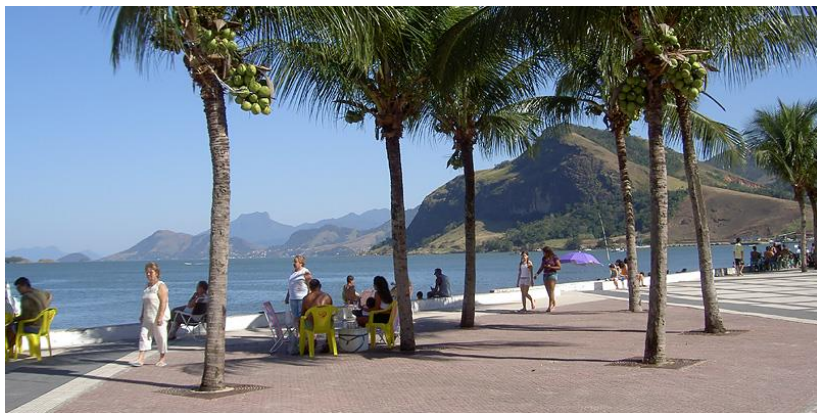
Muriqui, Mangaratiba (RJ).

geeft kan men kiezen aan een droger klimaat, meer regen, frisser of warmer. Brazilië is immers groot genoeg. De meer dan 7.000 km lange kustlijn heeft meer dan genoeg mooie stranden waar het goed is om in de buurt te wonen, met een frisse zeebries om de hitte draaglijker te maken.