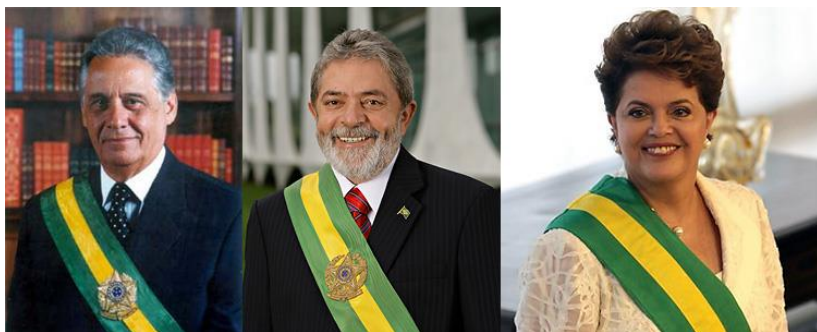
De Braziliaanse presidenten van de jongste decennia op een rijtje; v.l.n.r. Fernando Henrique Cardoso, Luiz Inácio Lula da Silva, Dilma Rousseff.

De hoofdstad van Brazilië is Brasília. Sinds 1988 is Brazilië een federale presidentiële democratische republiek waar de president tegelijk het staatshoofd en het hoofd van de regering is. Een van de basisprincipes van de politiek in de republiek Brazilië is het meer-partijen systeem, een garantie op politieke vrijheid. De administratieve structuur van de staat is een federatie. Nochtans vormen de gemeentes autonome politieke entiteiten waardoor de federatie een tripartite wordt: de regering, de afzonderlijke deelstaten (26 + 1 'estados') en de gemeentes (municípios). De drie machten zijn de uitvoerende macht, de wetgevende macht en de juridische macht. De uitvoerende macht ligt in handen van de regering met de president aan het hoofd die gekozen wordt voor een ambtstermijn van 4 jaar die eenmaal met dezelfde periode kan verlengd worden. De wetgevende macht is genesteld in het nationaal congres, een stelsel met 2 kamers. De volksvertegenwoordigers worden vierjaarlijks gekozen in een proportioneel systeem per staat. De senatoren worden voor een termijn van 8 jaar verkozen.