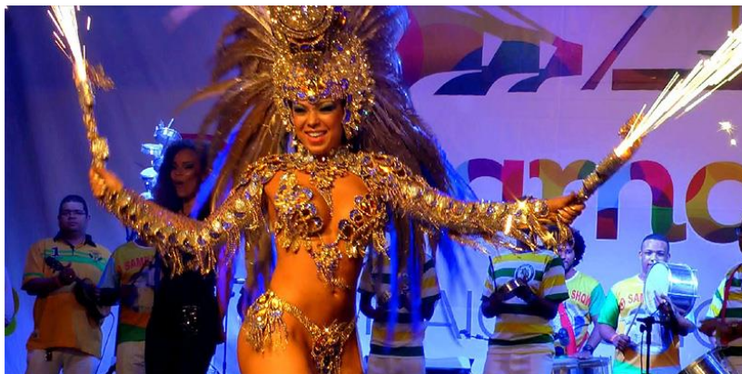
Rainha de Carnaval.

al een idee van de verscheidenheid. Beweren dat alle Braziliaanse vrouwen exotisch, slank en gebruind zijn, is dus niet correct. Er zijn blonde vrouwen met blauwe ogen en blanke huid, er zijn Aziatische types, er is een zwarte bevolking en alles wat daar tussen ligt als resultaat van gemengde relaties.