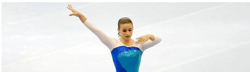
Jade Barbosa.