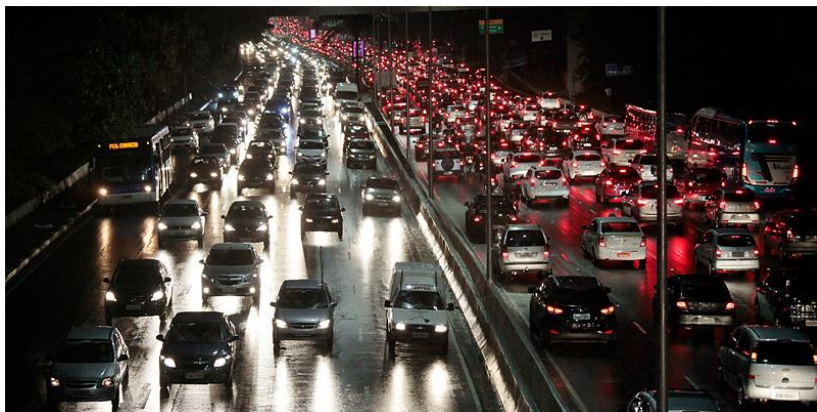
Het verkeer in São Paulo.

‘s nachts kunnen verkeerslichten niet vertrouwd worden. Brazilianen rijden ‘s avonds en ‘s nachts graag met flauwe standlichtjes, als ze niet vergeten om die aan te steken. Brazilianen rijden hard, erg hard. Of erg traag. Brazilianen rijden graag op de linkerrijstrook, ook al rijden ze trager dan de andere chauffeurs op de rechterstrook. Brazilianen houden van toeteren. Brazilianen zijn dol op inhaalmanoeuvres, liefst gevaarlijke. Van vrachtwagens en bussen houdt men best een veilige afstand. In Brazilië rijden er soms nog oude wagens rond, wrakken die telkens weer opgelapt worden. Een deel van de files wordt dan ook vaak veroorzaakt door voertuigen die plots stilvallen, ook omwille van gebrekkig onderhoud. De verkeersmoeilijkheden zijn erg groot in de grote steden, niet in het minst in steden als Rio de Janeiro en São Paulo. In deze laatste stad rijden dagelijks zowat zes miljoen voertuigen rond met alle nare gevolgen.