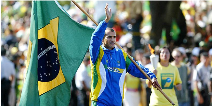
Atleet Vanderlei Cordeira, winnaar van een bronzen medaille in de marathon van 2004.

daarvan was goud. Brazilië deed voor het eerst mee aan de Olympische Spelen in 1920.