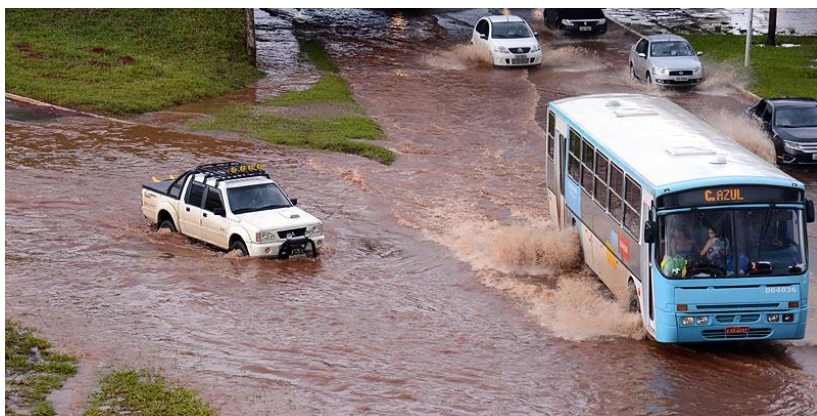
Ondergelopen straten in Brasília.