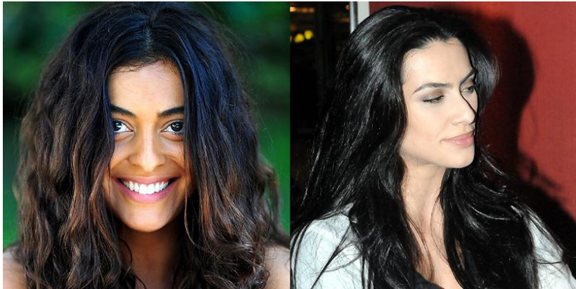
Juliana Paes en Cleo Pires.

eens het besluit trekken dat hij dan ‘wel een homoseksueel’ moet zijn.