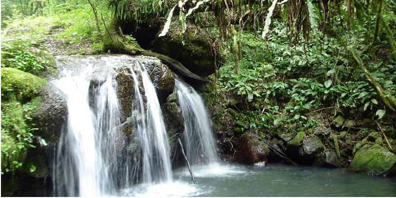
Mata Atlântica.

De stukjes regenwoud die er nog zijn hebben hun bestaan te danken aan de Braziliaanse overheid die net op tijd inzag dat bescherming nodig was. Daardoor bestaat er in de noordoostelijke staten zoiets als APA (Área de Proteção Ambiental), of de schoonheid van de Costa Verde in de staten Rio de Janeiro en São Paulo met uitschieters als Angra dos Reis, Paraty en andere mooie plekken zoals de Serrana regio rond Petrópolis, Teresópolis en Nova Friburgo.