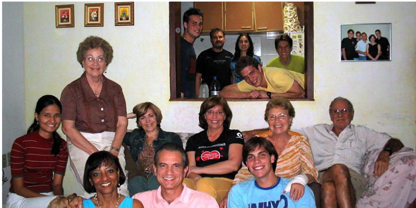
Braziliaanse familie.

De familie is heilig voor een Braziliaan. Nergens zult u zo hartelijk onthaald worden als bij een Braziliaanse familie. Het is een veilige haven, een voor allen en allen voor een. Levensvreugde, joelende kinderen, feestjes, bier, churrasco (barbecue), samen aan tafel, huilen, lachen, emoties, de familie staat centraal in het leven van de Braziliaan.