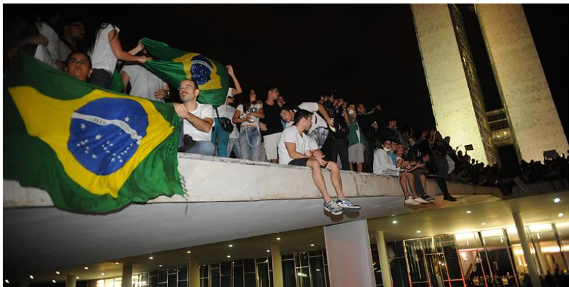
Betogers bezetten het parlement in de hoofdstad Brasília, in juni 2013.

De 'democratie' zoals wij die kennen in de lage landen, heeft een ietwat andere betekenis in Brazilië waar vaak nog het recht van de sterkste geldt, waar een buitenlander opkijkt van de straffeloosheid, het gebrek aan ethiek bij vele politici (niet in het minst die van de oude stempel), het vaak onnodige geweld van de mannen in uniform, de stedelijke (wan)orde, de maatschappelijke ongelijkheden, het gebrek aan respect voor het milieu. Dit alles leidde tot hevige protesten in juni 2013.