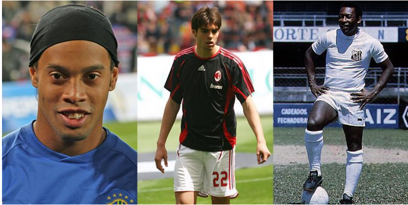
V.l.n.r.: Ronaldinho Gaúcho, Kaká en Pelé.

Het voetbal kwam in Brazilië terecht in 1895, via de Engelsen, zoals in vele andere landen. De eerste clubs dateren uit die tijd. Zowel de clubs als de spelers waren destijds exclusief voor de elite van het land. Arbeiders, kleurlingen en de lagere sociale klasse in het algemeen mochten hooguit de wedstrijden bijwonen. Het heeft enkele decennia geduurd alvorens ze ook stilaan mochten deelnemen. Alles veranderde totaal in 1933 toen het voetbal geprofessionaliseerd werd. Enkele clubs boden weerstand en bleven doorgaan op liefhebbersniveau. Langzamerhand begonnen ze zich pas later aan te passen aan de nieuwe realiteit, maar niet allemaal.