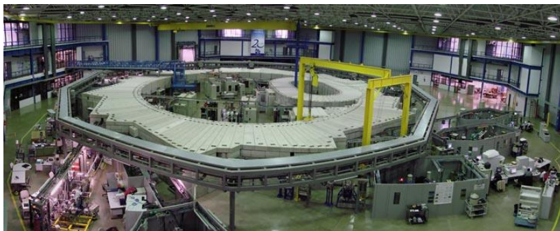
Laboratório Nacional de Luz Síncrotron – Campinas – SP.

In al die jaren in de status van ‘expat in Brazilië’ heb ik ontelbare malen antwoorden moeten geven op de meest uiteenlopende vragen over dit land. Mijn meningen & ervaringen zijn, uiteraard, persoonlijk. Er zijn vele andere expats, of toeristen die het land slechts sporadisch aan doen, emigranten die tevreden zijn, anderen teleurgesteld, investeerders die het volhielden, anderen die Brazilië de rug toekeerden, kortom evenveel mensen, evenveel meningen. Dat is goed. Het zou verkeerd zijn een mening te vormen en een beslissing te nemen, afgaande op de mening van 1 mens. ‘Get yourself a second opinion’, we schreven het al eerder.