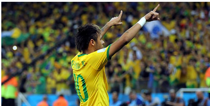
Neymar tijdens een wedstrijd van het WK 2014.

alles te maken met een zeker gevoel van nationale trots. Bij grote wedstrijden die uitgezonden worden op de televisie zijn regelmatig opzwepende jingles te horen (Brazil..il..il..il... met een echo). Commentators hebben altijd een bijzonder lange adem, nodig om Goooooooooooooooooooooooooooooilllll te roepen als er weer eens een doelpunt gemaakt wordt. Maar ook andere sporten zijn populair, niet in het minst de autosport, volleybal e.v.a. Bij de laatste uitgave van het WK ging het wat bergaf met de Braziliaanse prestaties. Mogelijk heeft dit te maken met de alsmaar stijgende welvaart. Jongeren kijken op naar voetballers als Neymar, een inspirerend idool, inclusief zijn bekende hanenkuif. Zij kijken vooral naar de uiterlijkheden van zo 'n status: fame & fortune. Cracks worden te pas en te onpas opgevoerd in televisieprogramma's, reclamespots, tijdschriften en internetportalen waar ze hun mening mogen verkondigen. Voormalige cracks worden sportjournalist (Ronaldo) of beginnen een carrière in de politiek (Romário). Er leuk uitzien zoals krullenbol David Luiz of ladykiller Neymar streelt het ego, niet altijd met positieve gevolgen.