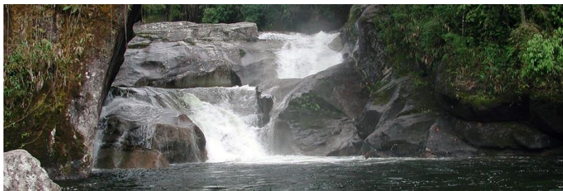
Een van de vele watervalletjes in het nationale park van Itatiaia.

helemaal een feit. Dit moest het aards paradijs zijn, zo dacht ik. De eerste avond kon ik nauwelijks de slaap vatten; de stilte was indrukwekkend buiten wat krekels en hier en daar het geblaf van een hond in de verte. Ik strekte me uit op het grasveld naast mijn chalet en zag een sterrenhemel die enkel nog in mijn dromen bestond. Deze keer was het geen bedrog. Het gebrek aan enige lichtvervuiling toonde me het heelal zoals het is. Ik kon me niet meer herinneren dit ooit te hebben gezien in eigen land. De dagen nadien trok ik het nationale park in en kon zelf vaststellen hoe het almachtige oerwoud 'Mata do Atlântica' er ooit in zijn geheel moet hebben uitgezien. Vooral de vele watervallen met kristalhelder water maakten indruk, maar ook de exotische planten, bloemen en bomen. Zo mooi als de Ardennen ook zijn, dit was anders, gigantisch, enorm, verpletterend schoon.