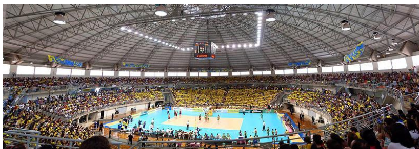
De Braziliaanse volleybal selectie tijdens een vriendschappelijke wedstrijd tegen de USA in Uberlândia (MG) in 2009.

Volleybal staat op het moment op de tweede plaats wat belangstelling betreft. De competitie wordt georganiseerd door de 'Superliga Brasileira de Voleibol', opgesplitst in mannelijke en vrouwelijke deelnemers. In de jongste jaren kenden de Braziliaanse selecties erg goede resultaten; Brazilië bekleedt de eerste plaats in de ranking van de Internationale Volleybal Federatie, in beide modaliteiten. De vrouwelijke selectie behaalde vier Olympische medailles, twee bronzen en twee gouden. Het team is op dit moment vicewereldkampioen en de belangrijkste winnaar van de Grand Prix, met negen titels. Het mannelijke team werd driemaal wereldkampioen en behaalde 5 Olympische medailles, 2 gouden en drie zilveren. Ze werden tweemaal wereldkampioen en zijn de grootste winnaars van de 'Liga Mundial', met negen titels.