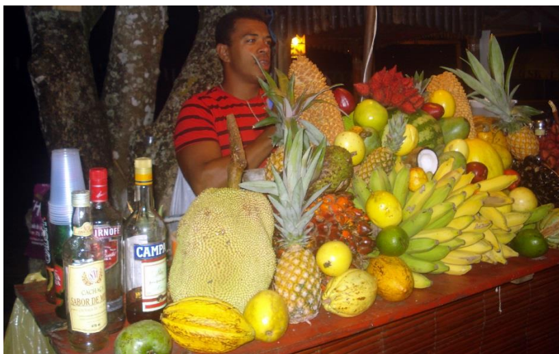
Verse tropische vruchten zijn heerlijk!

oorlogen zijn werkelijk onmogelijk op deze manier. Terroristen maken geen schijn van kans in Brazilië. Voor de anderen: mens erger je niet. De zon schijnt overvloedig, de tropische vruchten zijn heerlijk, de natuur overweldigend mooi, de Braziliaanse medemens erg hartelijk. Brazilië-reizigers laten de stress best thuis. Zoveel te meer valt er te genieten van de voordelen in het vorige zinnetje.