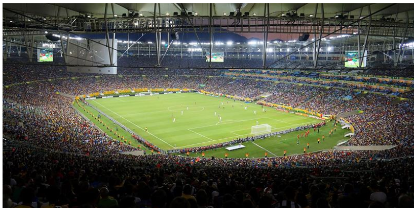
Het stadion Maracanã in Rio de Janeiro.

In Brazilië worden diverse sporten beoefend, georganiseerd door nationale confederaties. Het belangrijkste is het Comitê Olímpico Brasileiro. Het zal geen verrassing zijn dat voetbal de meest beoefende sport is van het land. Diverse sporten zijn van Braziliaanse oorsprong: Peteca (Indiaca), Zandborden, Frescobol (Matkot), Strandvoetbal, Futebol de Saco (futsac), Biribol (een soort water volley), Futetênis, Acuaride en Futevôlei. Wat vechtkunsten betreft zijn vooral Capoeira, Vale-tudo en Jiu-jitsu brasileiro van Braziliaanse aard en oorsprong.