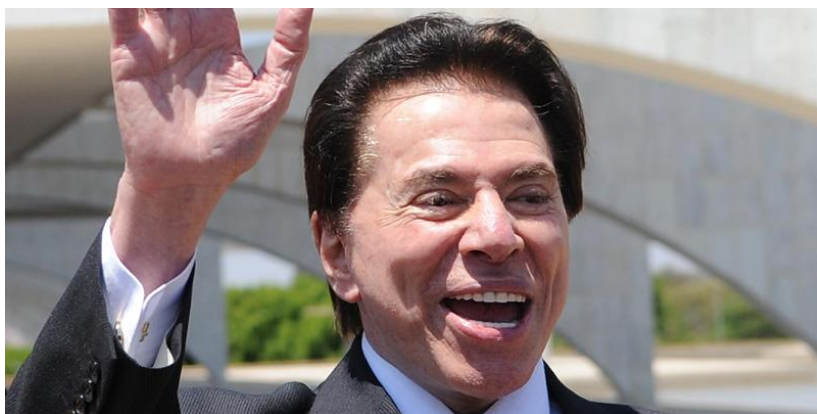
Silvio Santos.

Breed aanbod waar veel te genieten valt voor de selectieve kijker. Digitale televisie deed zijn intrede. In de meeste steden en ook deels in het binnenland is kabeltelevisie beschikbaar, meestal inclusief CNN, BBC World, Bloomberg, MTV, Discovery, HBO, Fox, Warner, Sony, Animal Planet, Deutsche Welle, MGM of Canal Rural (waar de ganse dag Braziliaanse koeien te zien zijn). De belangrijkste Braziliaanse openbare stations zijn O Globo, Rede Record, Bandeirantes en SBT. Record en Bandeirantes zijn van evangelische strekking. SBT is het commerciële tv-station van de altijd glimlachende en gladjes afgestreken Silvio Santos.