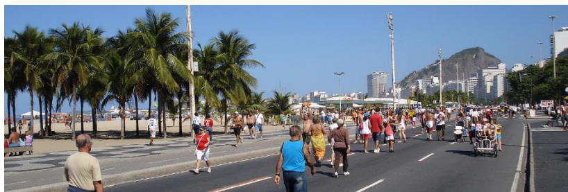
Wandelen langs de Avenida Atlântica in Copacabana. Op zo een moment worden de gedachten aan gevaarlijke sloppenwijken wel even naar de achtergrond geduwd.

De meeste buitenlandse zakenlui kijken verbaasd op wanneer ze geconfronteerd worden met het feit dat zakendoen met Brazilianen ook dikwijls inhoudt dat er vriendschap in het spel moet zijn. Brazilianen hebben er moeite mee om zaken en vriendschap van elkaar te scheiden. Een zakenman is tegelijk een gewone burger maar ook een bedrijf. Vriendschap sluiten met beiden bevordert de onderhandelingen en schept vertrouwen. Wil je zakendoen in Brazilië, zorg dan dat je bevriend raakt met je toekomstige partner. Vele dingen zijn gebaseerd op de uitwisseling van diensten. De uitspraak 'Aos amigos, tudo, aos inimigos, a lei' (voor mijn vrienden alles, voor mijn vijanden de wet) wordt soms toegeschreven aan voormalig president Getúlio Vargas, maar het zinnetje is gemeengoed in Brazilië en past perfect in de Braziliaanse realiteit. M.a.w. vriendjespolitiek met als enige excuus: het lost mijn probleem op!