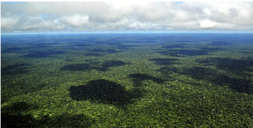
Een luchtfoto van het regenwoud nabij Manaus.

Carnaval, het regenwoud, de stad Rio de Janeiro, uiteraard zijn dat bekende begrippen, een gevolg van de nogal eenzijdige berichtgeving in de media van andere landen. Alledrie trekken ze de aandacht omdat ze extreem zijn. Het carnaval is nergens zo spectaculair als in Brazilië, het regenwoud staat bijna continu in het nieuws omwille van zijn unieke aard als groene long van onze planeet, en de stad Rio de Janeiro is een toeristische wereldtopper met bovendien het jaarlijkse carnaval als uitschieter. Het loont nochtans zeer de moeite om verder te kijken.