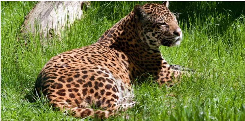
Een 'Onça Pintada' (jaguar) in het Pantanal-gebied.

De stukjes regenwoud die er nog zijn hebben hun bestaan te danken aan de Braziliaanse overheid die net op tijd inzag dat bescherming nodig was. Daardoor bestaat er in de noordoostelijke staten zoiets als APA (Área de Proteção Ambiental), of de schoonheid van de Costa Verde in de staten Rio de Janeiro en São Paulo met uitschieters als Angra dos Reis, Paraty en andere mooie plekken zoals de Serrana regio rond Petrópolis, Teresópolis en Nova Friburgo.