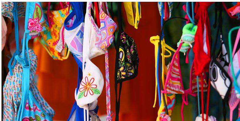
Op de markt van Conde, Bahia.

Aan winkels & shoppings en markten geen gebrek. Het aanbod is gewoon te gek. Braziliaanse spullen zijn kleurrijk, exotisch, mooi en wie de moeite neemt om te vergelijken, te kiezen en te keuren, kan zaakjes doen.