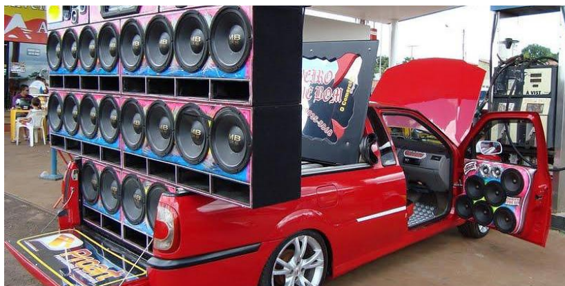
'Carro de Som': Brazilianen (niet alle) zijn er dol op.

voertuigen, het hoort bij het dagelijks Braziliaans leven. Om rust te vinden in Brazilië moet een rustig plekje gezocht worden. Wil men alle comfort in de buurt: winkels, bakkers, banken enzovoort, dan leeft men dicht bij Brazilianen en bij het lawaai dat ze maken. Uitzonderingen bevestigen de regel.