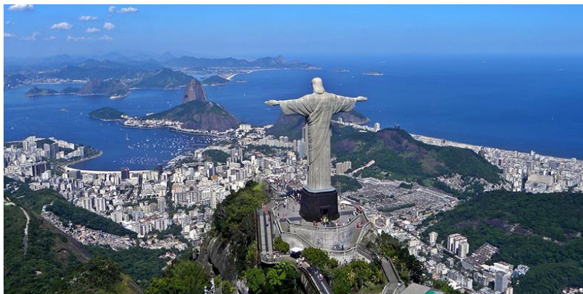
Cristo Redentor.

inwoner van de zona sul kijkt wat neer op de zona norte en zou er niet willen wonen. Beide bevolkingsgroepen worden symbolisch gescheiden door het Cristo beeld op de Corcovado berg dat met de rechterarm naar de rijken wijst, en met de linker naar de minder gefortuneerden.