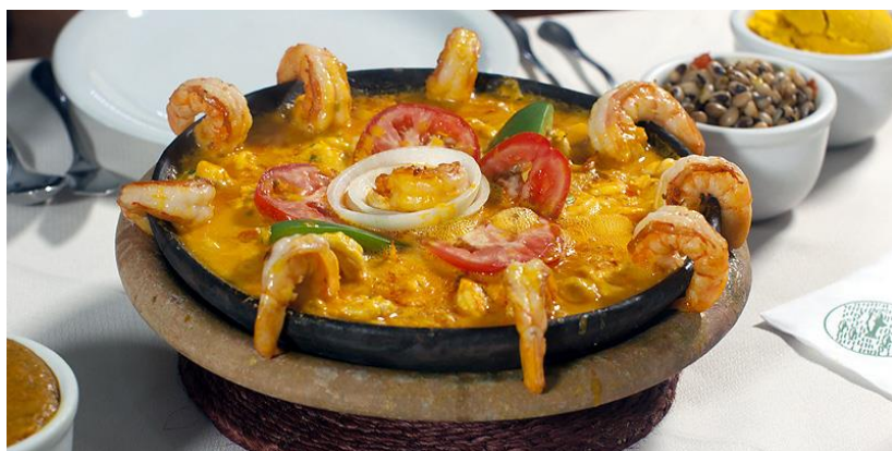
Moqueca, een typisch gerecht uit Bahia.

hygiëne vaak te lijden krijgt omdat de eetwaren gewoon in de blakende zon liggen. Het is voor een gringo even wennen aan typische Braziliaanse gewoontes om overal en altijd rijst en bonen bij te eten, of dingen als farofa (maniok) en andere mysterieuze gerechten die men niet kent. Frieten bakken kunnen ze niet, een lekkere saus bereiden wordt ook weinig gedaan. Brazilianen houden van grote hoeveelheden en diversiteit. Braziliaanse wijn is maar zo zo van kwaliteit, uitzonderingen niet te na gesproken. Importwijnen zijn duur. Kazen zijn ook duur. Bier is redelijk goedkoop maar wordt naar Europese maatstaven erg koud opgediend, te koud eigenlijk.