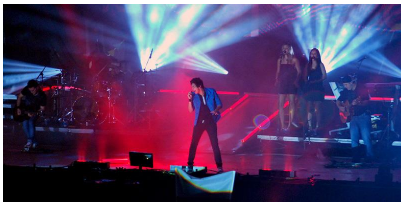
De razend populaire Sertanejo ster Luan Santana.

Samba is slechts een van de vele muziekstijlen die populair zijn in Brazilië. Er bestaan andere stijlen zoals Sertanejo, Forró, Axé, Bossa Nova, Zouk-Lambada, Choro, Maracatu, MPB (Música Popular Brasileira), Funk Carioca, Pagode, Seresta, Tropicália.. de lijst is haast eindeloos. Een vrij goede beschrijving van de Braziliaanse muziek is te vinden op deze Wikipedia pagina , inclusief 500 jaar geschiedenis.