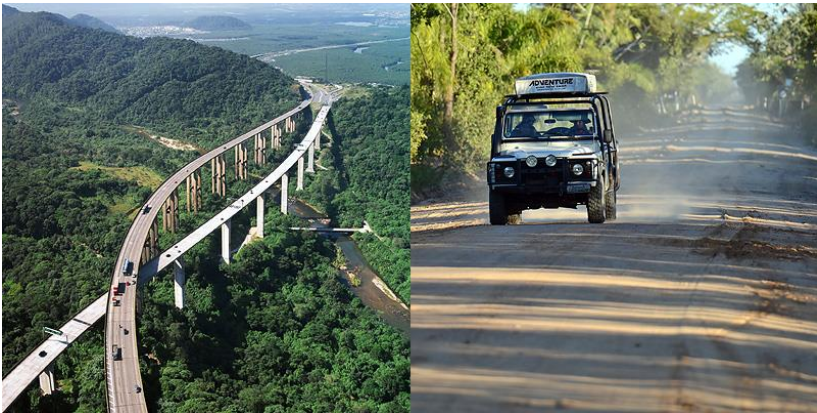
Rodovia dos Imigrantes (SP-160)(links) en een stukje van de 'Transpantaneira' in Mato Grosso.

Braziliaanse wegen zijn gewoon goed, slecht of superslecht. De verkeersdrempels ('quebra mola' of 'lombada') zijn monsterlijke hindernissen die een wagen en een goed humeur om zeep kunnen helpen. Er zijn veel gaten, maar geen nood. Brazilianen steken er takken van struiken of bomen in om de collega autobestuurder te waarschuwen voor het gevaar.