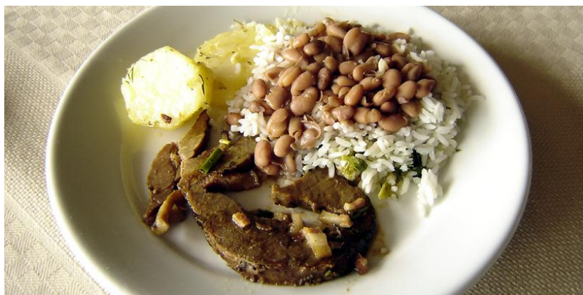
Rijst & bonen, (Arroz & Feijão) met een stukje vlees.

verhalen over de prachtige natuur, de tropische stranden, de gastvrije bevolking, exotisch vrouwelijk schoon, palmbomen, kokosnoten en grillrestaurants waar rijen kelners aanschuiven om het lekkerste vlees ter wereld op te dienen. Een caipirinha is plots de fijnste cocktail ter wereld, rijst en bonen couleur locale. Het hoort er bij en dus is het lekker. Viva Brasil!