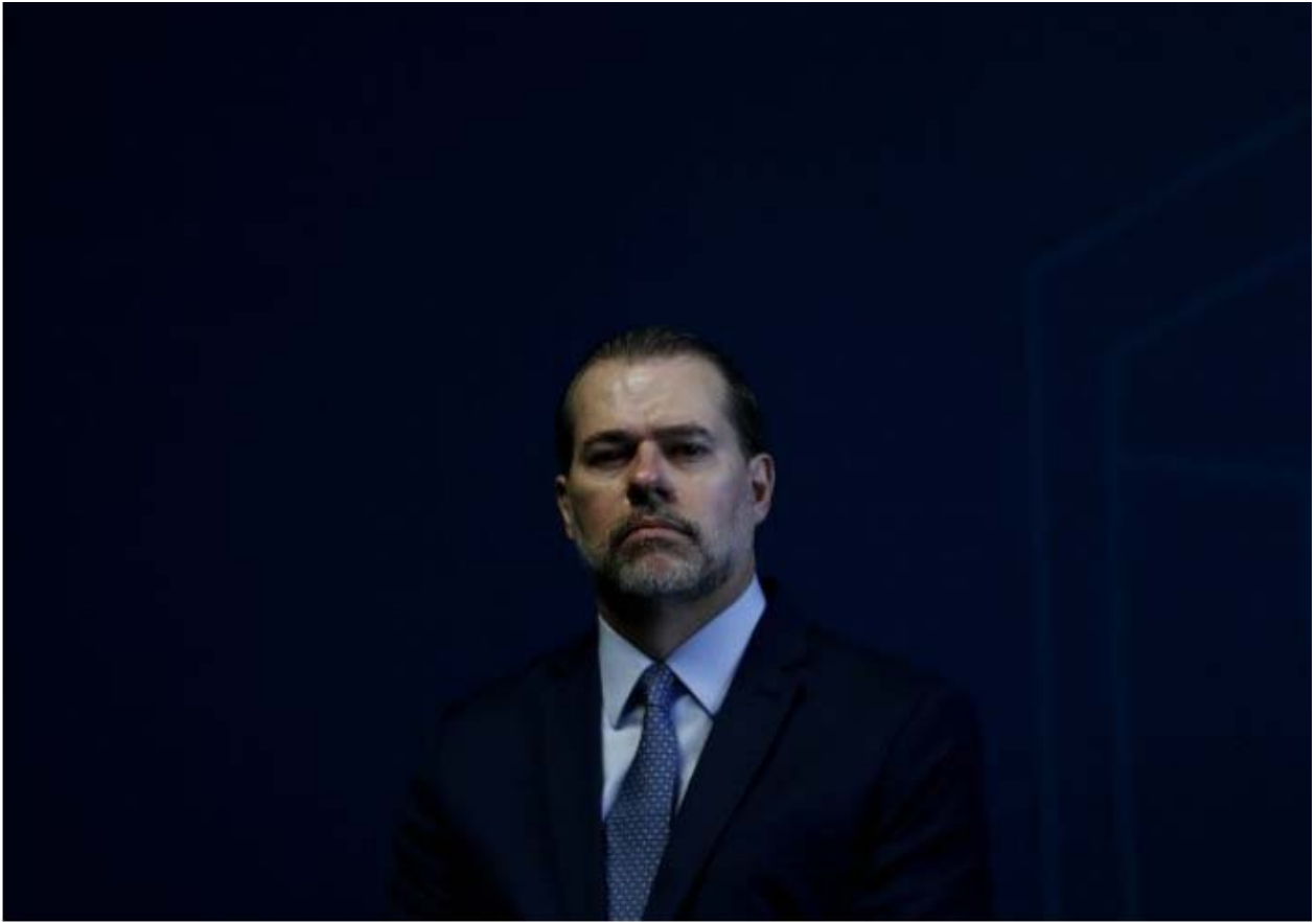
O presidente do Supremo: mensagens se referem ao período em que ele chefiou a AGU, no governo Lula

Em documento a que Crusoé teve acesso, o empreiteiro Marcelo Odebrecht revela à Lava Jato o codinome usado para se referir a Dias Toffoli na empreiteira