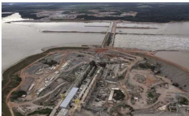
A usina de Santo Antônio, em Rondônia: uma das prioridades da era petista

Com as respostas do empreiteiro-delator, a Lava Jato deverá dar mais um passo nas investigações sobre os leilões das hidrelétricas. Uma das frentes de apuração, que mira a construção da usina de Belo Monte, já está avançada. Quanto à menção de Marcelo Odebrecht a Dias Toffoli, não se sabe, até aqui, se a Procuradoria-Geral da República pedirá algum tipo de esclarecimento ao ministro antes de decidir o que fazer. Como advogado-geral da União, Toffoli tinha a atribuição de lidar com o tema. Até por isso, não é possível, apenas com base na menção a ele, dizer se havia algo de ilegal na relação com a empreiteira. Mas explicações, vale dizer, são sempre bem-vindas.