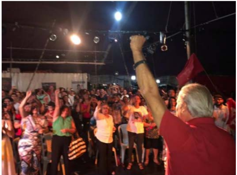
O lançamento do livro em Ilhéus, na Bahia, foi dentro de um circo

Nas conversas com amigos e colegas de partido, Dirceu tem deixado transparecer o desânimo. Embora ainda insista em tratar de política, e se esmere na distribuição de recomendações a serem seguidas pelo PT na oposição, ele gasta a maior parte do tempo falando sobre a expectativa do retorno à prisão.