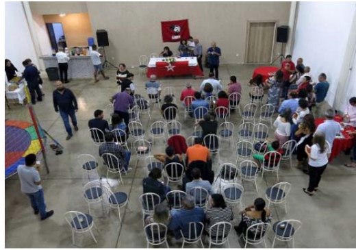
O evento desta quinta na cidade do Gama, perto de Brasília: menos de 50 presentes

Apesar da perda de influência, Dirceu tem mantido relação permanente com os correligionários,